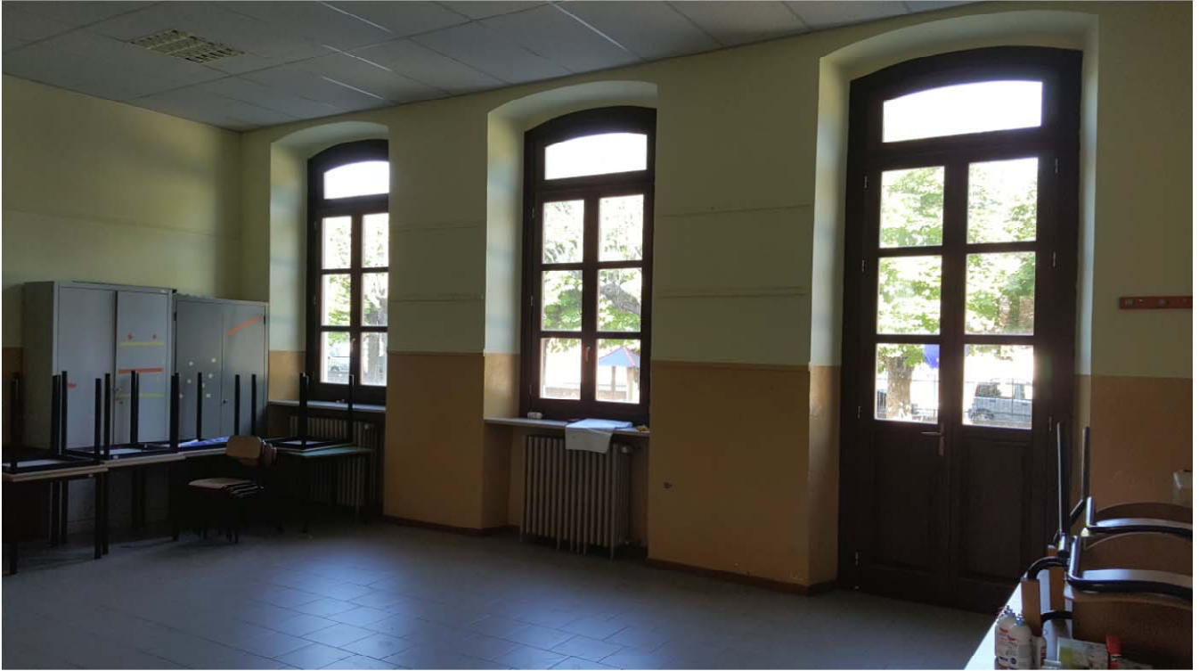
AULA PIANO TERRENO