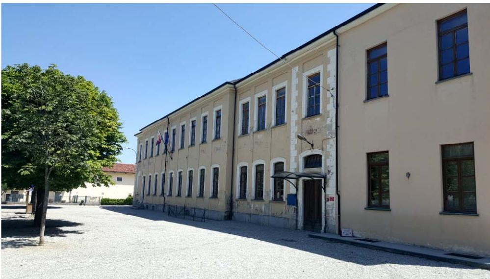
SCUOLA ELEMENTARE PROSPETTO ESTERNO