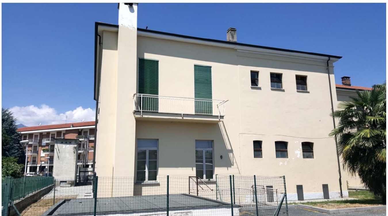
SCUOLA ELEMENTARE PROSPETTO ESTERNO