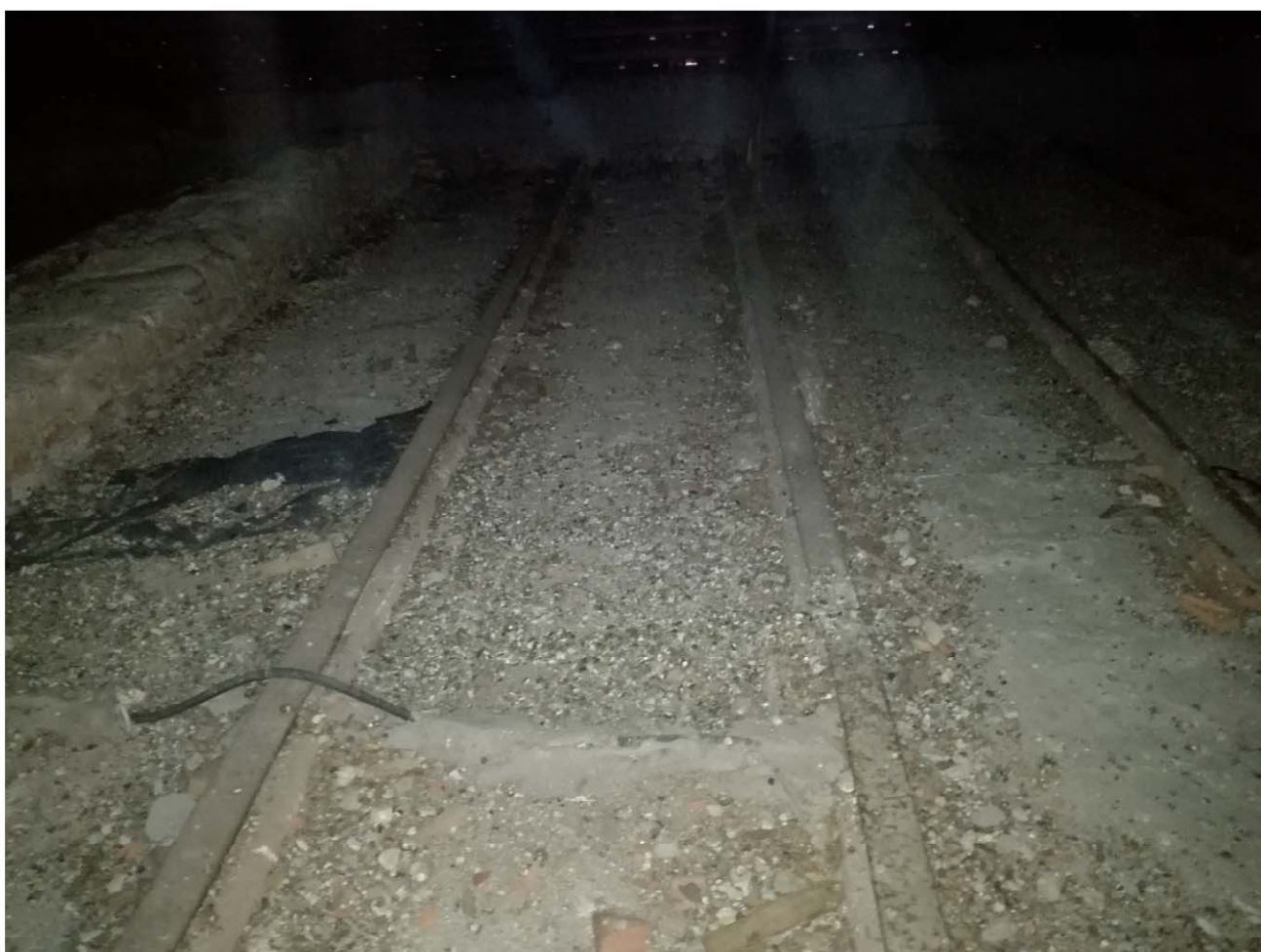
SOTTOTETTO - SOLAIO PUTRELLE - VOLTINI