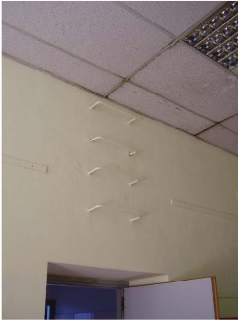
SCALA DI ACCESSO AL SOTTOTETTO