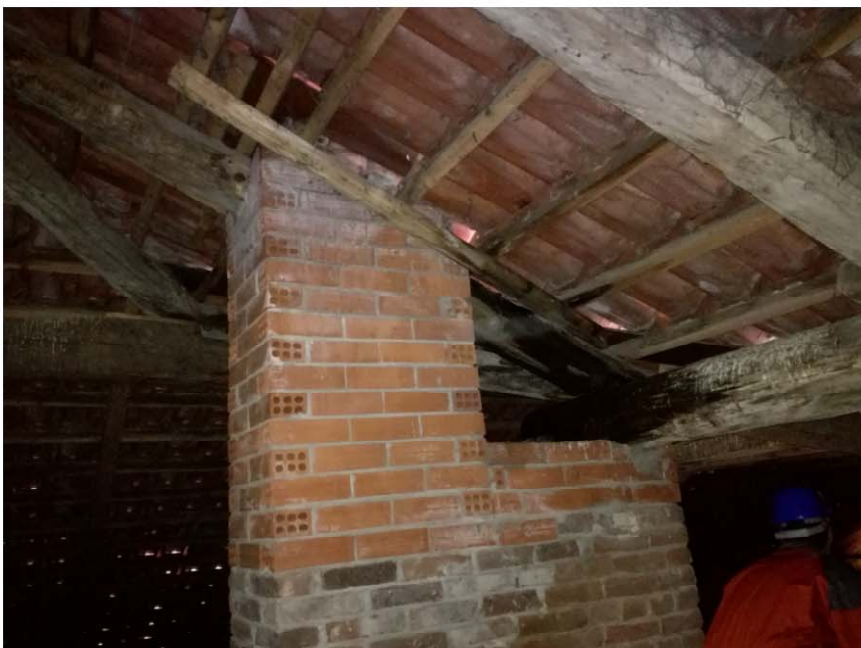
SOTTOTETTO - PARTICOLARE PUNTONI E LISTELLI