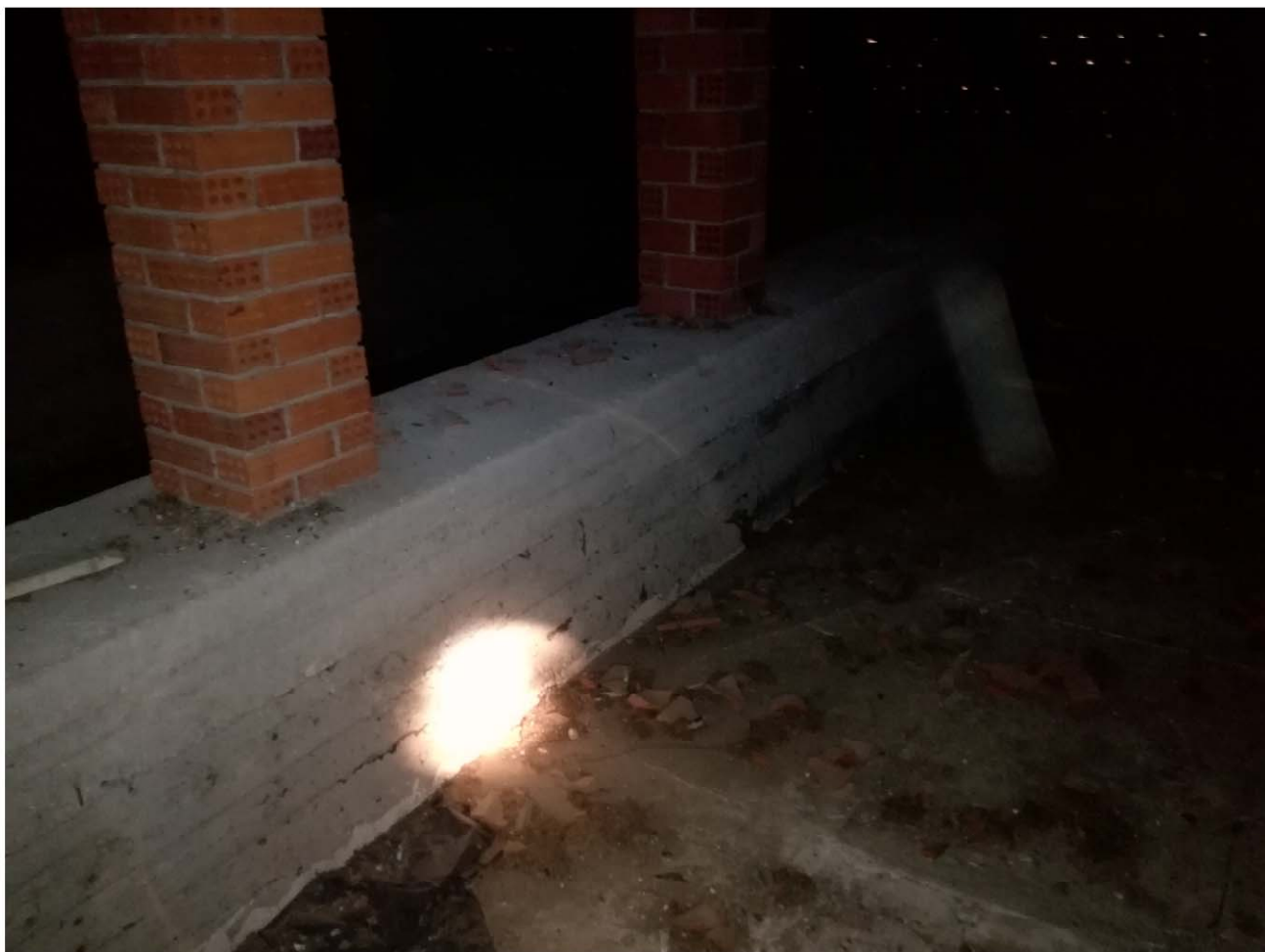
SOTTOTETTO - TRAVE RIALZATA IN C.A.