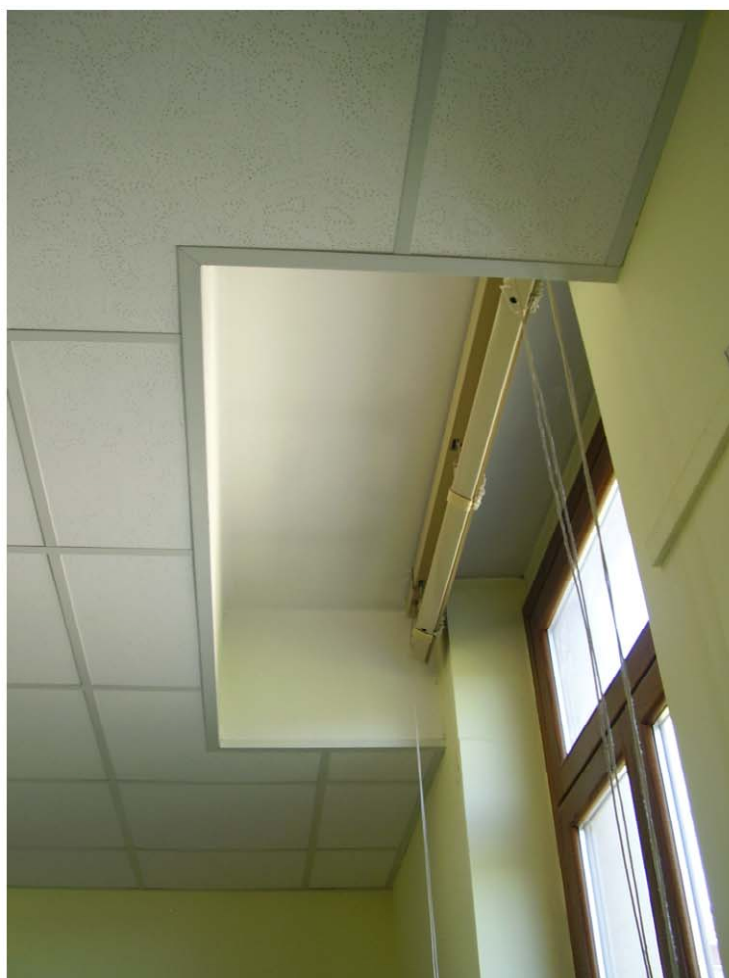
PARTICOLARE CONTROSOFFITTO PIANO PRIMO