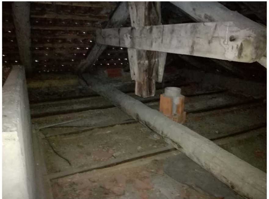
SOTTOTETTO - CAPRIATA TETTO IN LEGNO