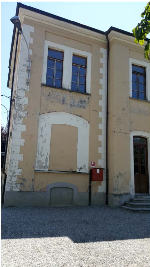
SCUOLA ELEMENTARE PROSPETTO ESTERNO