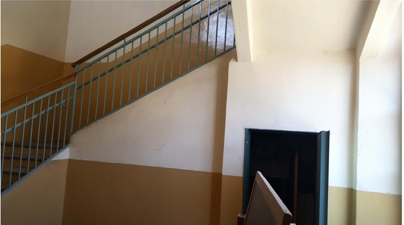
SCALA IN MURATURA