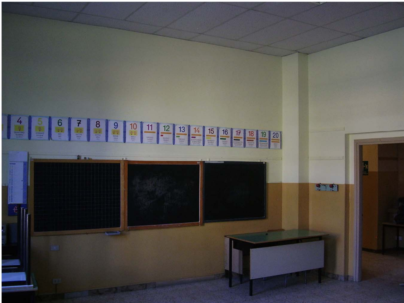
AULA PIANO PRIMO