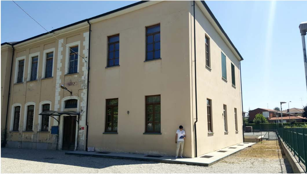
SCUOLA ELEMENTARE PROSPETTO ESTERNO