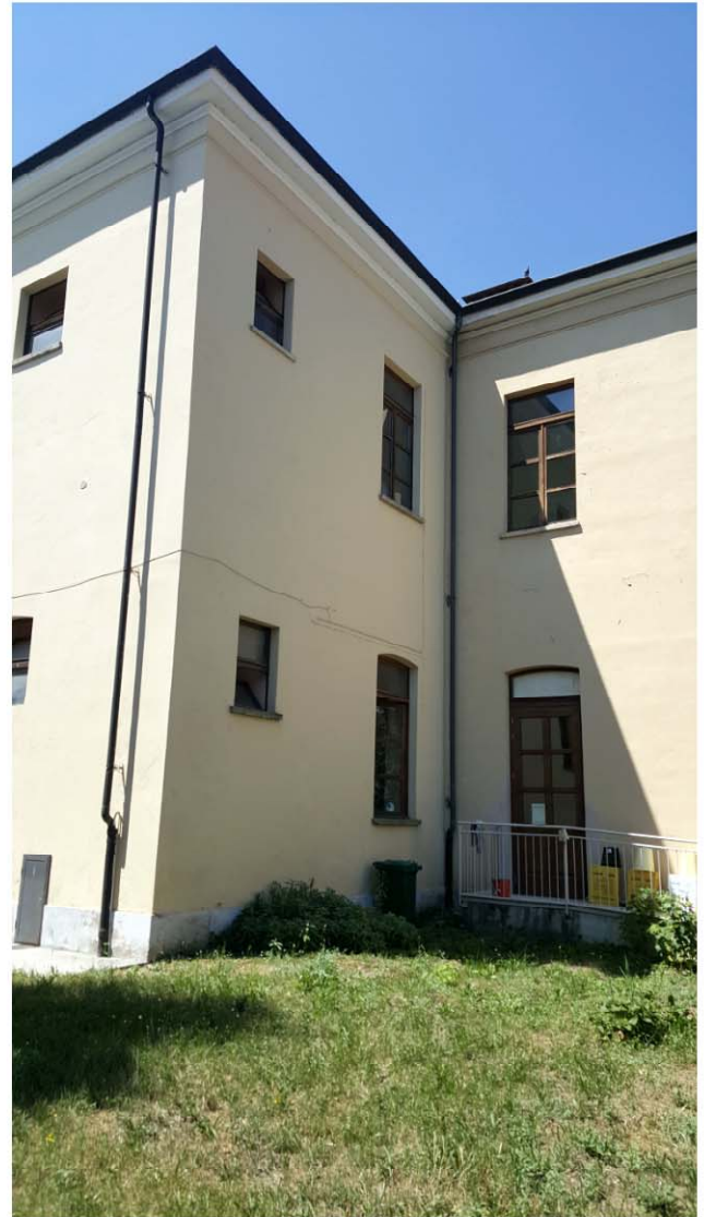
SCUOLA ELEMENTARE PROSPETTO ESTERNO