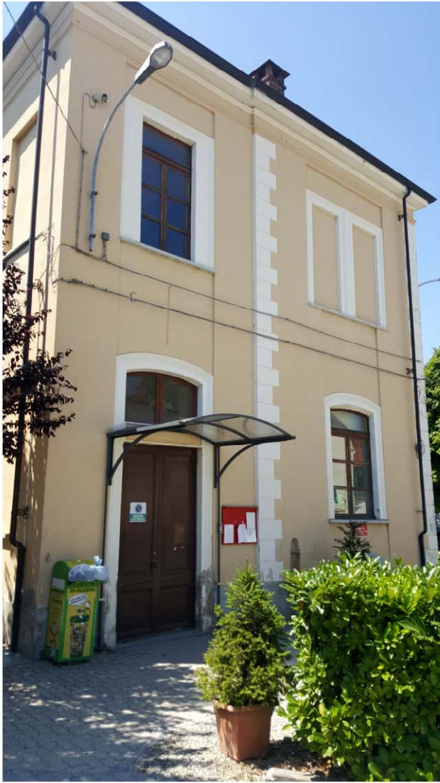
SCUOLA ELEMENTARE PROSPETTO ESTERNO