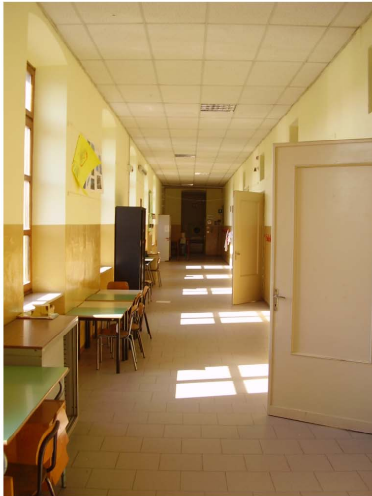
CORRIDOIO PIANO TERRENO