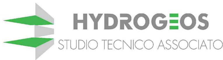
TAVOLA N° G