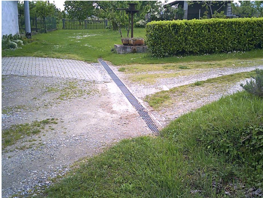
Fotografia n. 2: Area di realizzazione canaletta grigliata (area non vincolata D.lgs. 42/2004).