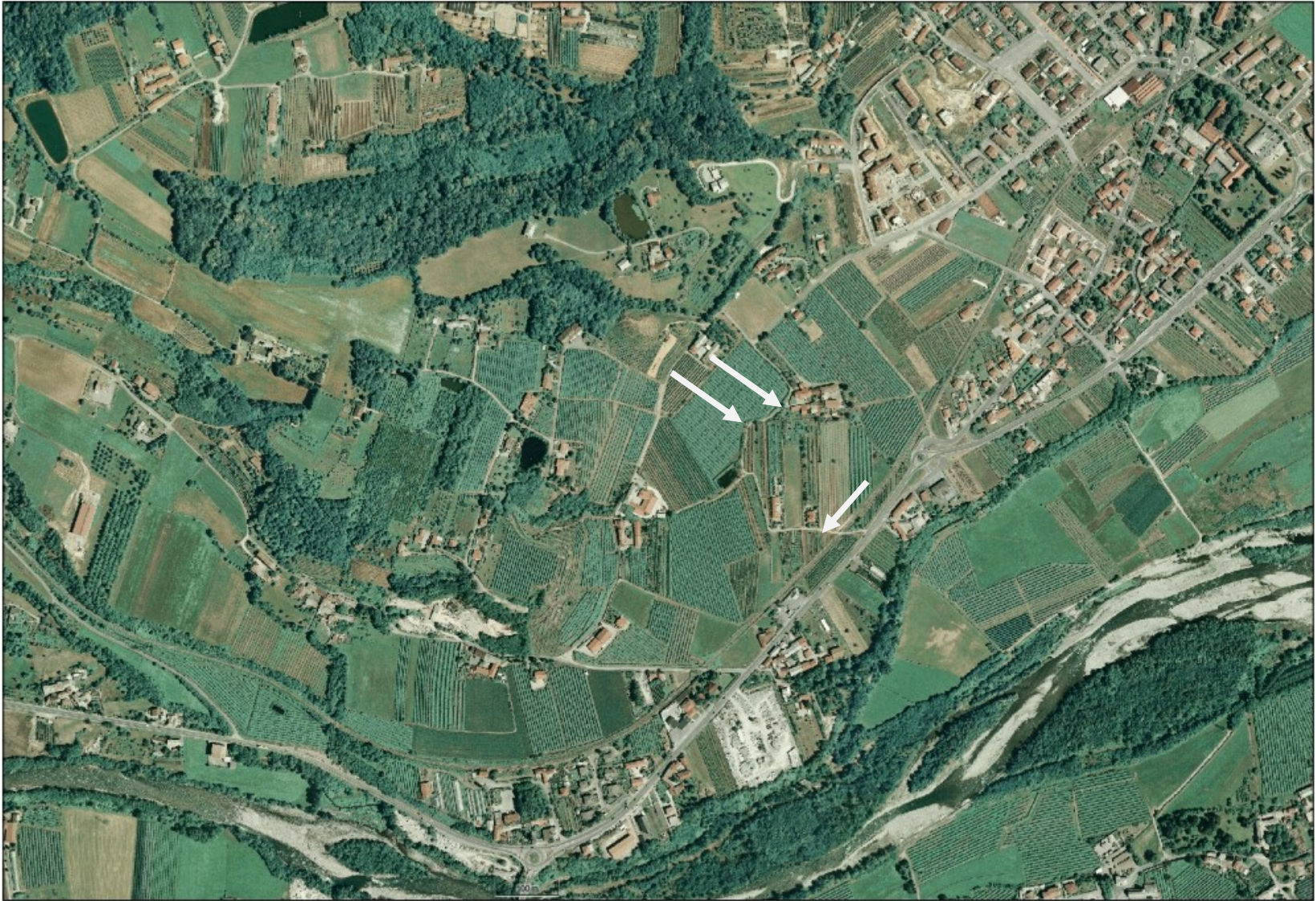
Fotografia n. 1 : tratto di strada da sistemare (su ortofotocarta).