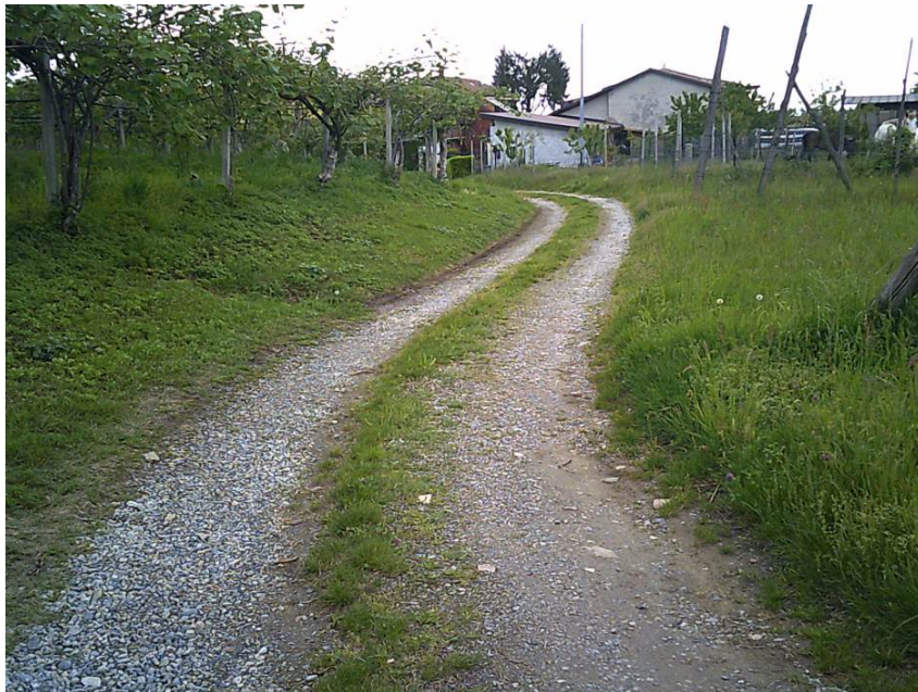
Fotografia n. 3: Sito di realizzazione canalette trasversali (area non vincolata D.lgs. 42/2004).