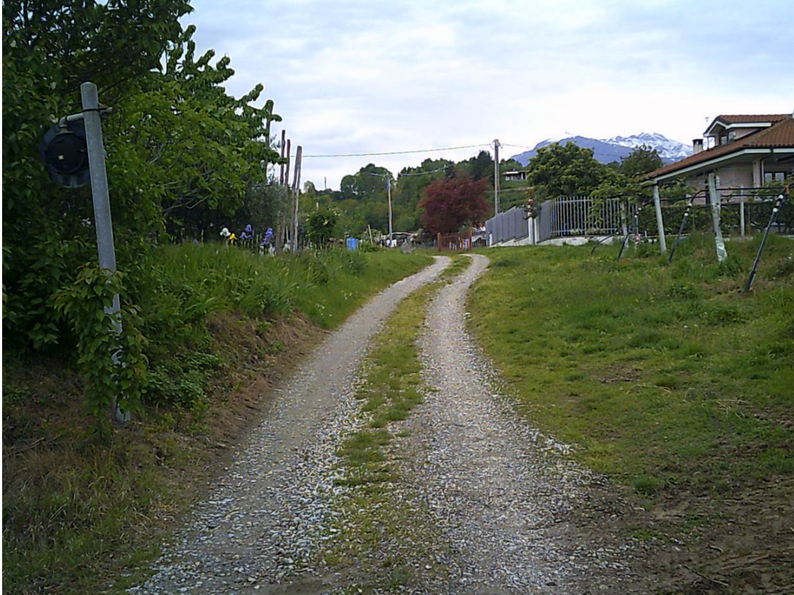
Fotografia n. 4: Sito di realizzazione sovrastruttura cementata (area vincolata D.lgs. 42/2004).