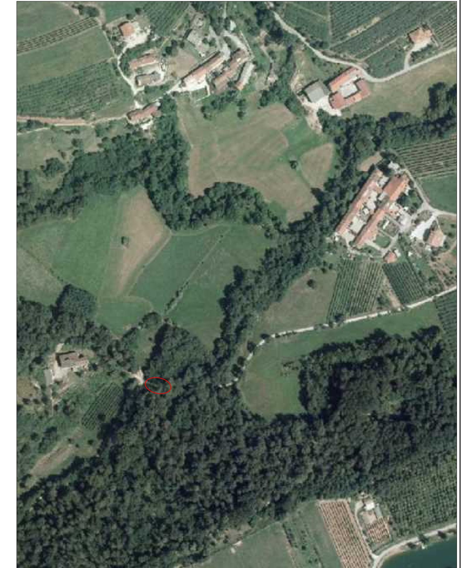
ESTRATTO DI ORTOFOTO Scala 1:2.500