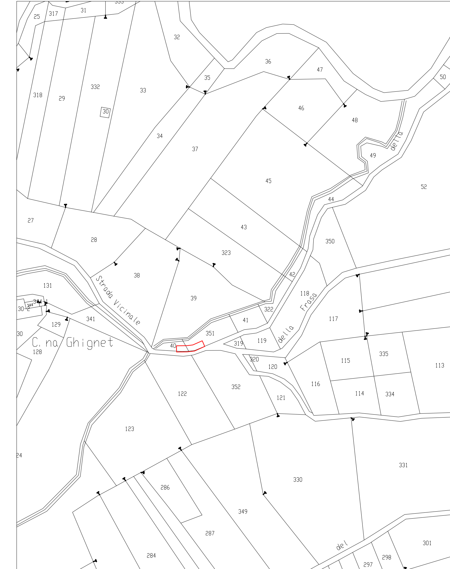
Foglio 26 del Comune di Bricherasio